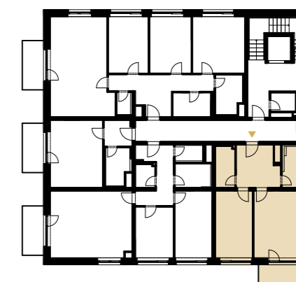
3.NP | 2 nd floor