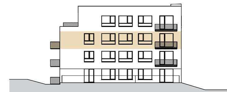
Jižní pohled | Southern view