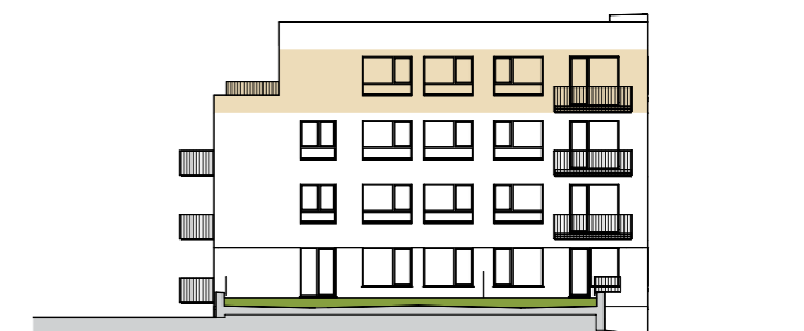
Jižní pohled | Southern view