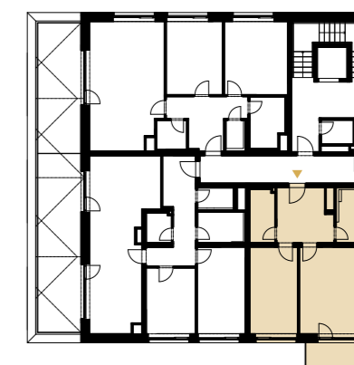
4.NP | 3 rd floor